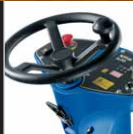
Verstelbaar stuurwiel voor excellent gebruikerscomfort.